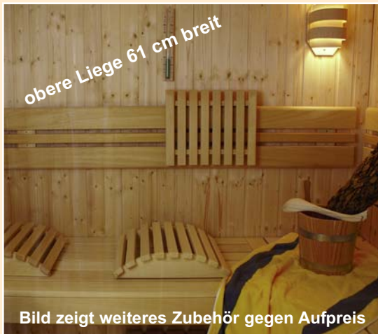
obere Liege 61 cm breit